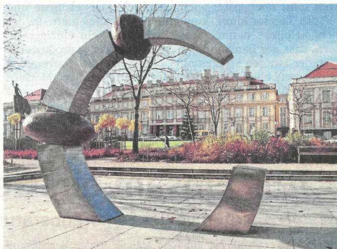
Bernsteinring vor dem Rathaus in Pruszcz Gdanski.

liegen bei circa 50 Euro pro Person pro Nacht mit Frühstück. Es ist durchaus möglich, dass die Stadt Pruszcz Gdanski einen extra Preis aushandeln wird.